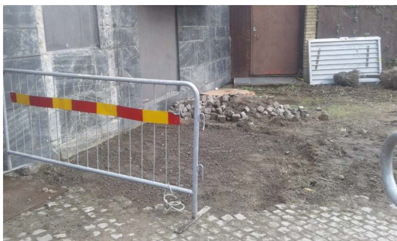
Figur 3. Schaktad yta för brandtrappa, sett från sydväst.

Inga fortsatta åtgärder behövs, arbetet är slutfört.