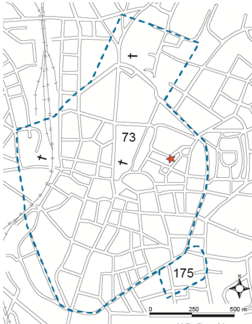
Figur 1. Lunds medeltida stad, fornlämning 73:1, med platsen för undersökningen markerad med en röd stjärna.