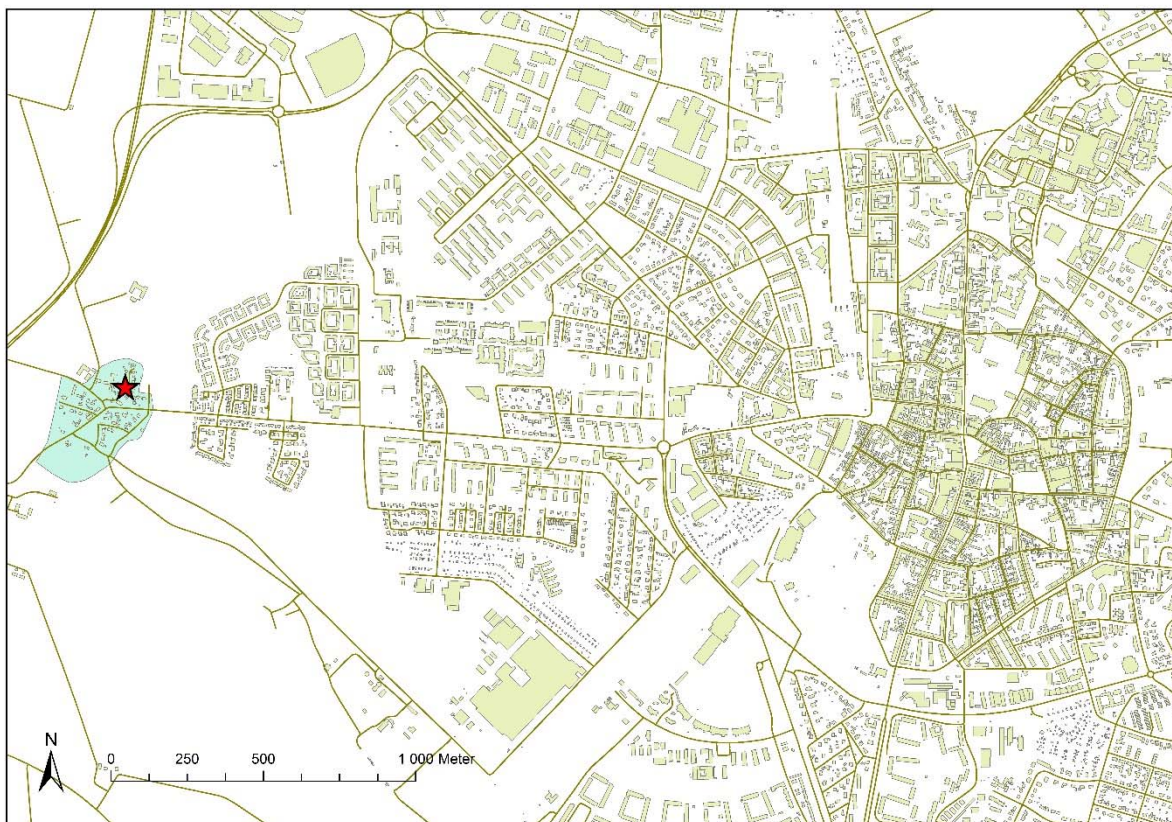
Figur 1. Värpinge bytomt, fornlämning Lund 156:1, i Lunds västra ytterområde. Platsen för undersökningen markerad med röd stjärna.