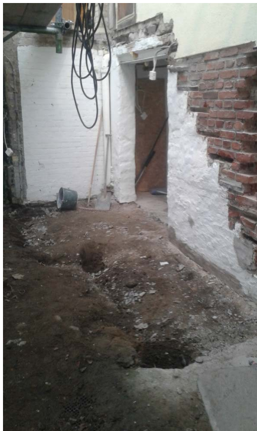
Figur 3. Schakt för trappfundament på innergården i fastigheten kvarteret Glädjen 15. Foto från NV.