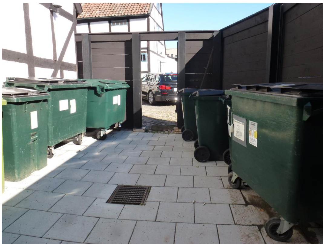
Efter åtgärder. Inne i det stängda sophanteringsutrymmet vy mot norr och gårdsplan.