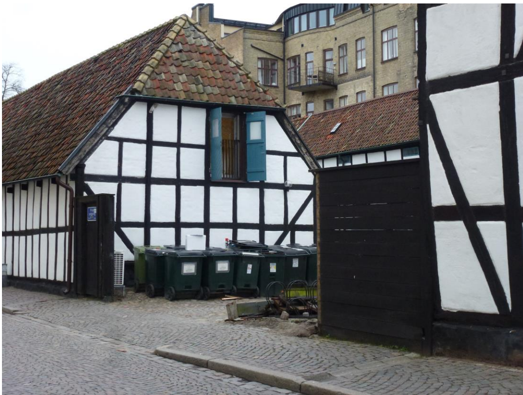
Före åtgärder. Vy längs Paradisgatan. Sophanteringen invid gårdsplan. En del av planket till höger i bild har redan tagits ner.