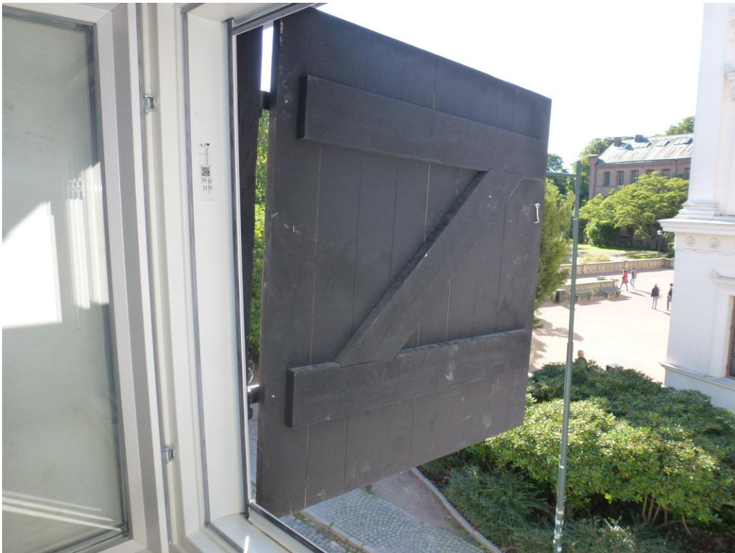
Efter åtgärder. Ny utrymningsväg med nytt fönster och ny trälucka.