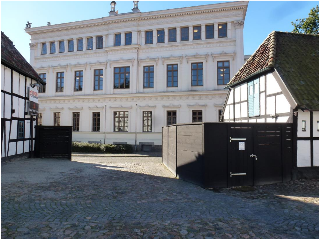
Efter åtgärder. Nytt plank kring sophantering. Återstår att måla gångjärnen svarta.