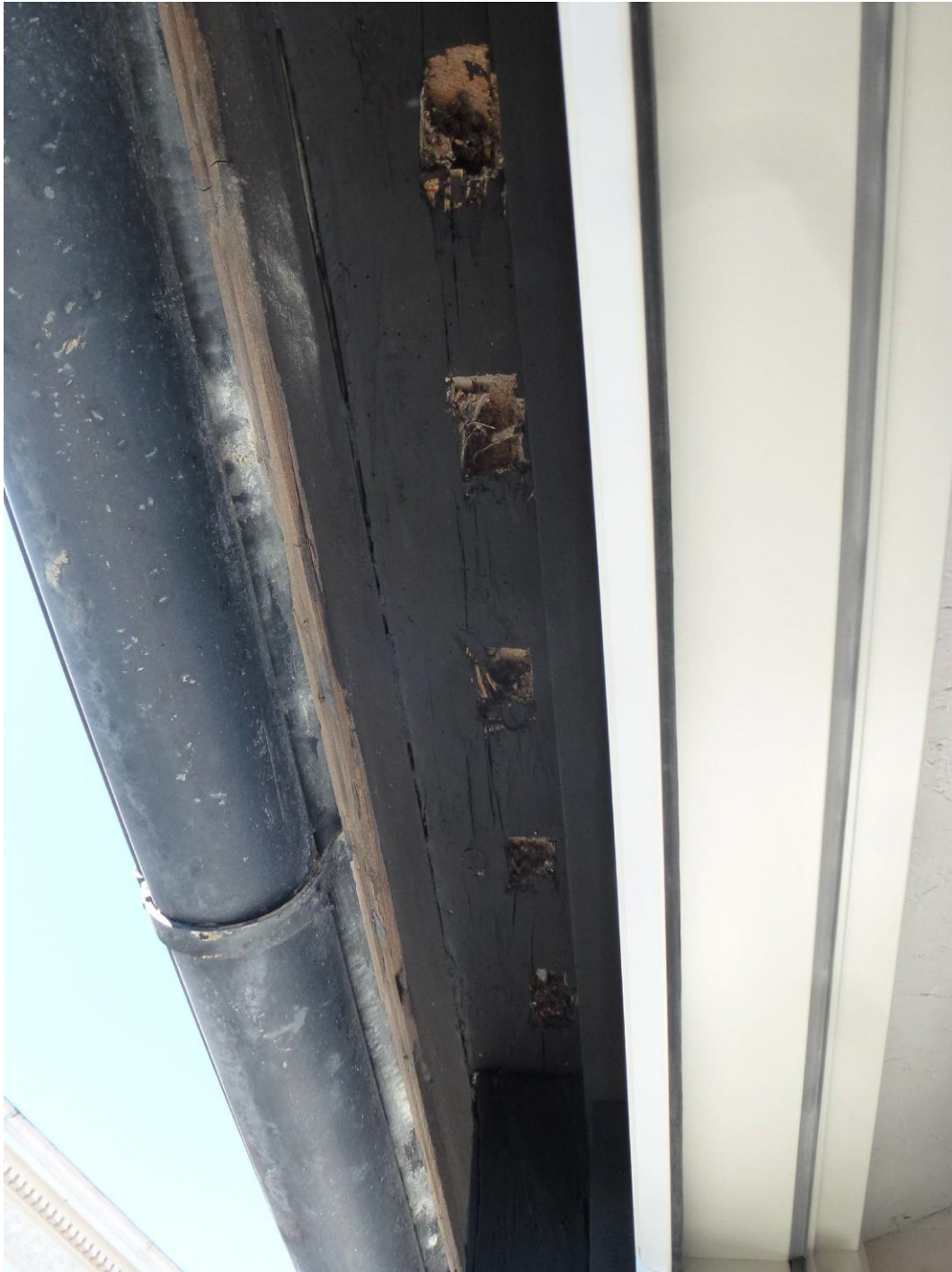
Efter åtgärder vid utrymningsvägen. Hål efter lerstakar finns synliga i lejden. Hålen skyddas av takfoten.