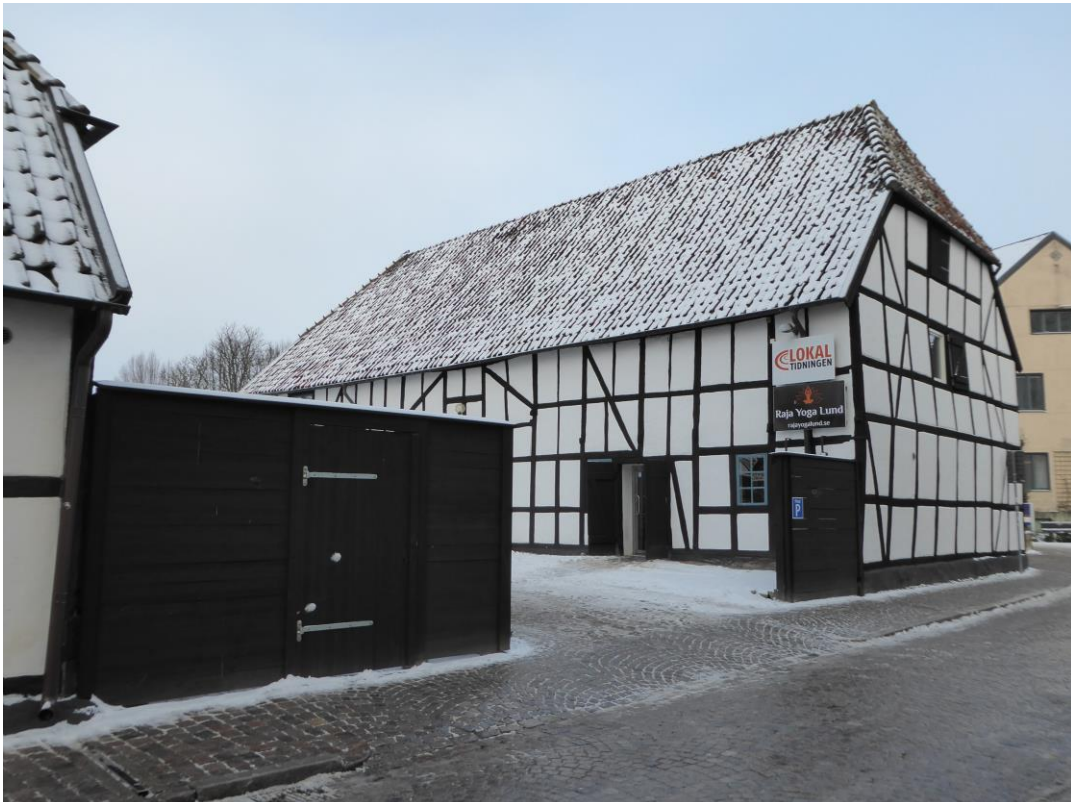
Efter åtgärder. Vy längs Paradisgatan. Nytt plank kring sophantering till vänster i bild. Återstår att måla gångjärnen svarta. Ny utrymningsväg genom den översta luckan på byggnaden till höger i bild.