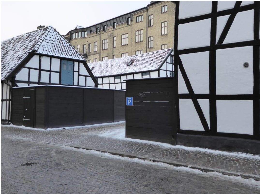
Efter åtgärder. Vy längs Paradisgatan. Nytt plank kring sophanteringen till vänster i bild. Planket med P skylt har förkortats.