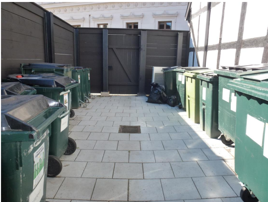
Efter åtgärder. Inne i det stängda sophanteringsutrymmet vy mot söder.