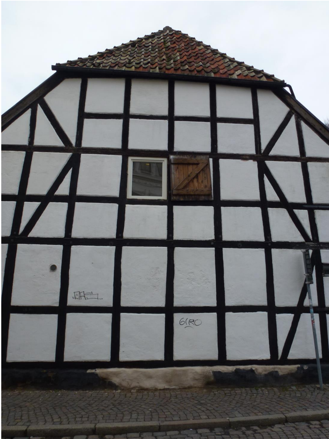
Före åtgärder. Den östra byggnaden, gavelfasaden intill Paradisgatan.