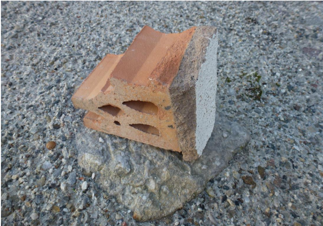
Den nedplockade fyllningen bestod av håltegel och puts av hårt, cementaktigt, bruk.