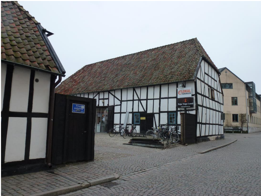
Före åtgärder. Vy längs Paradisgatan. Till höger i bild den östra byggnaden där utrymningsväg ska tas upp.