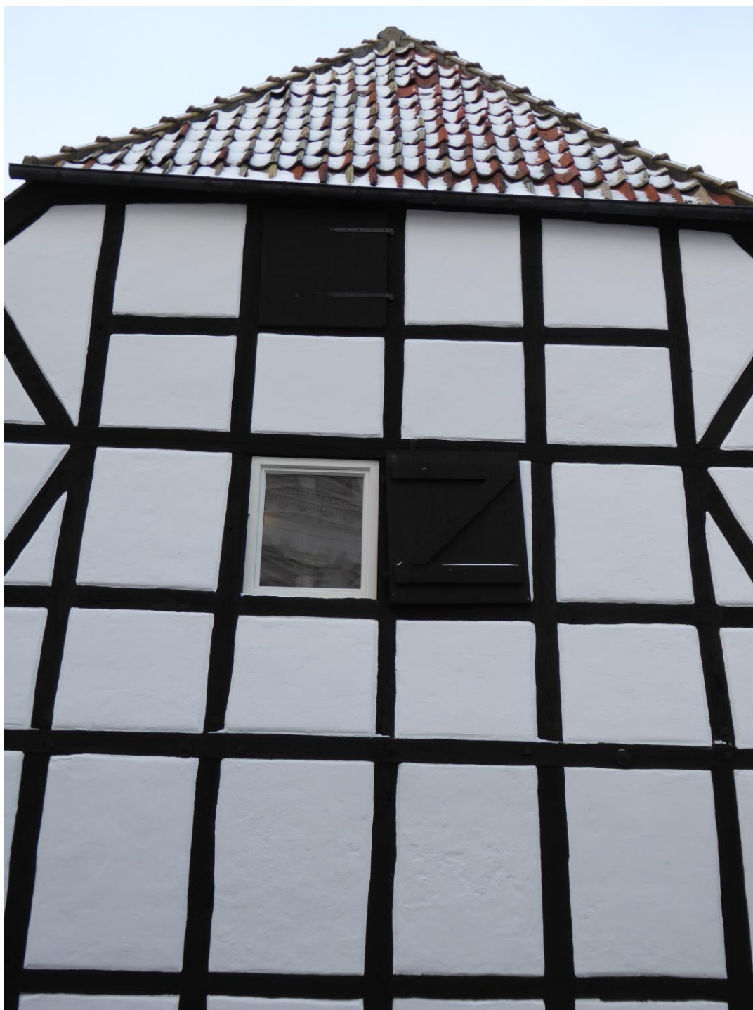
Efter åtgärder. Ny utrymningsväg finns bakom den övre luckan.