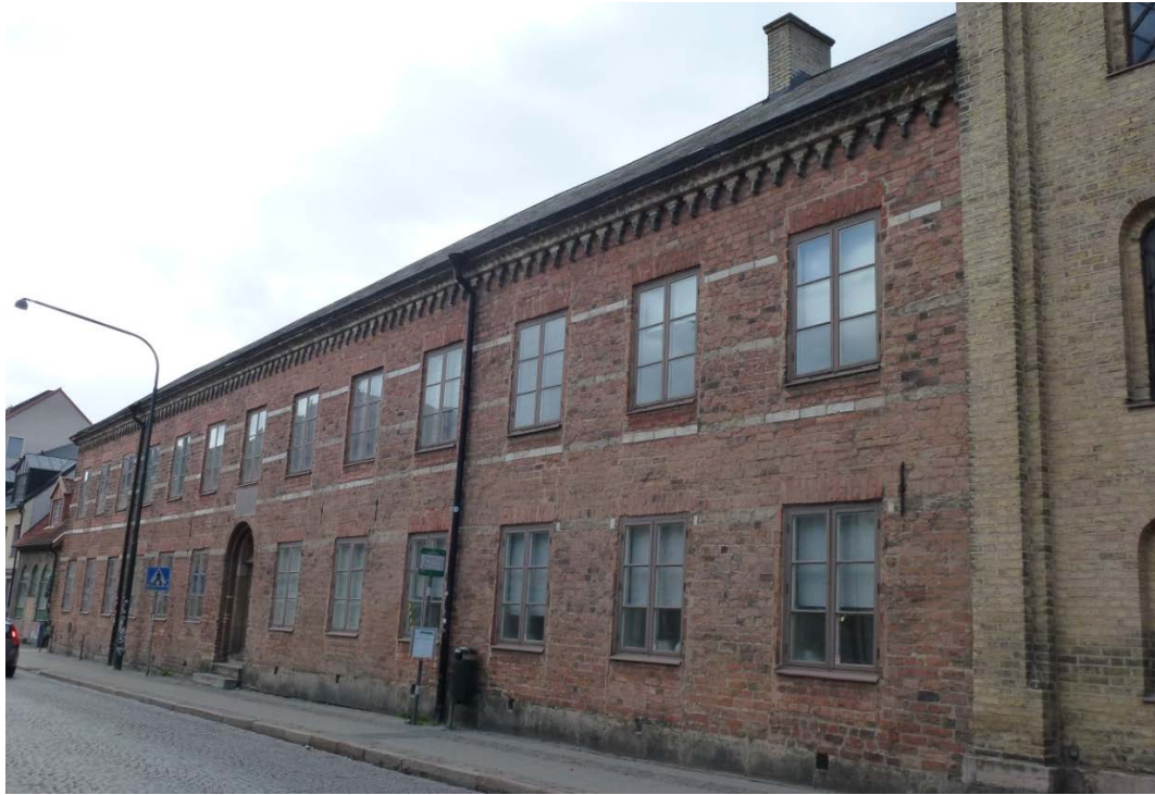
Före åtgärderna. Gatufasaden mot Stora Södergatan.