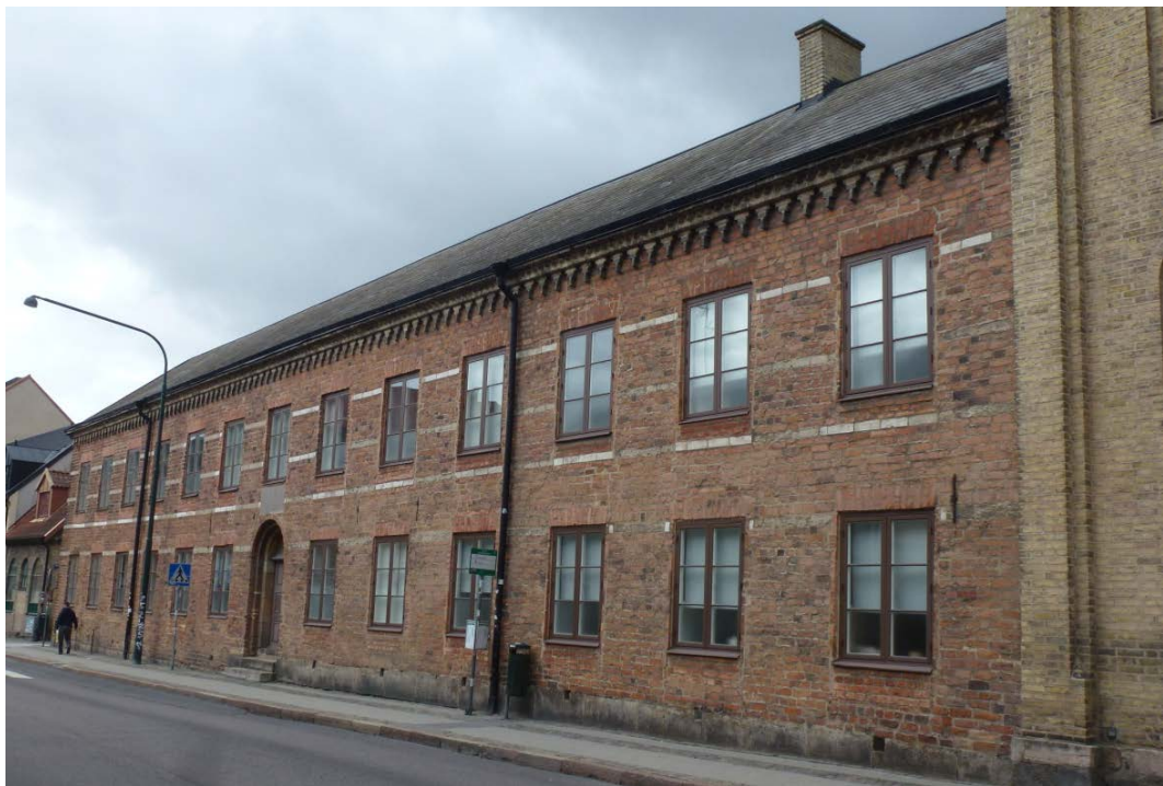
Efter åtgärderna. Gatufasaden mot Stora Södergatan.