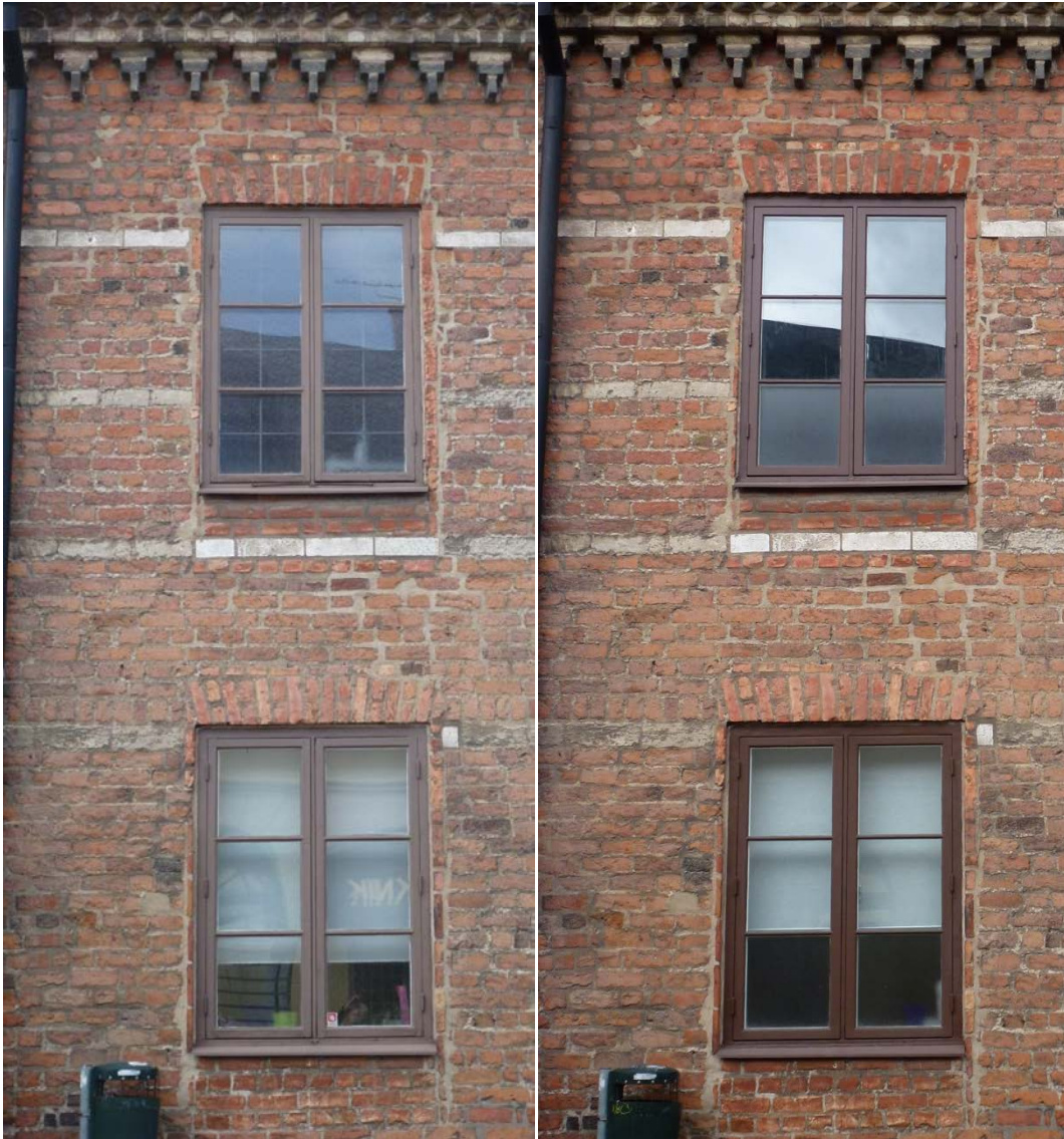
Vänster: Före åtgärderna. Höger: efter åtgärderna. I övre våningen har ett tredje gångjärn tillkommit.