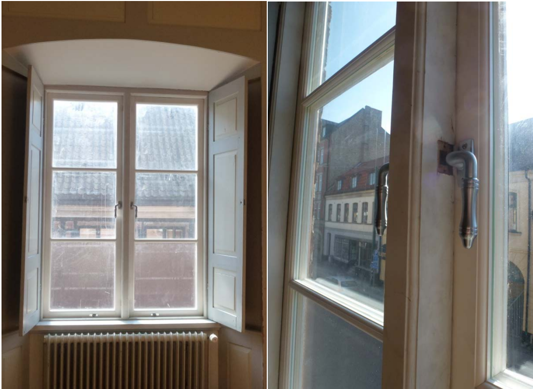
Efter åtgärderna. Fönster på andra våningen. Bågarna har ungefär lika profilering som på de borttagna bågarna.