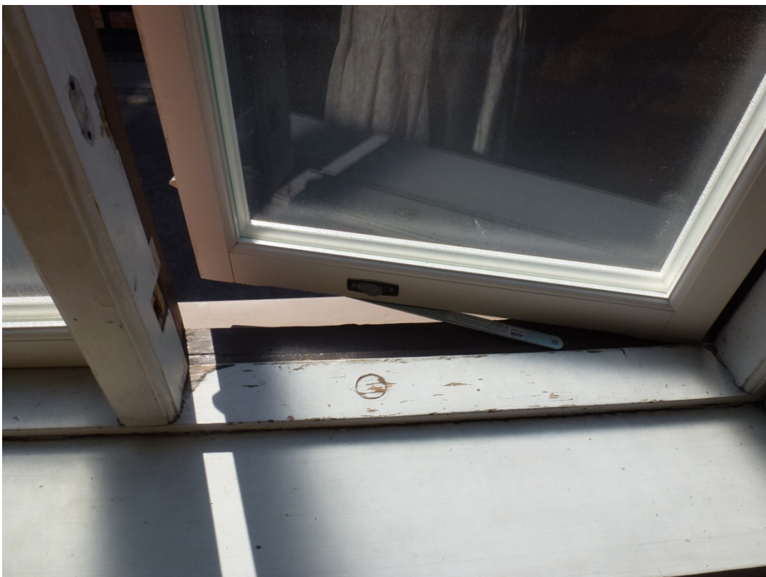
Efter åtgärderna. Nya bågar och glas samt barnlås monterat.