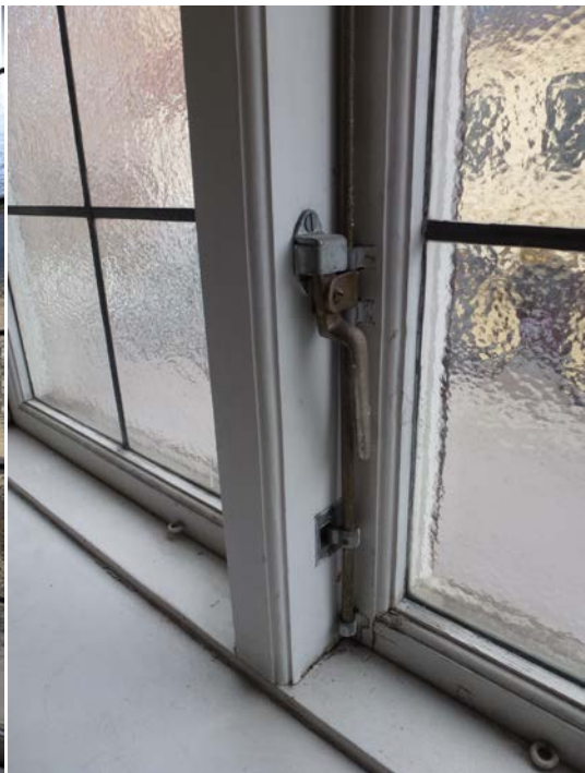
Före åtgärderna. Fönster på andra våningen.