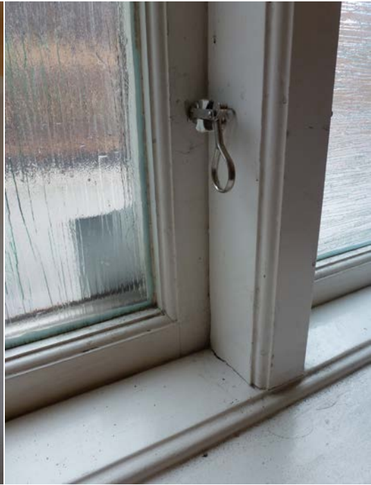
Före åtgärderna. Fönster på första våningen.