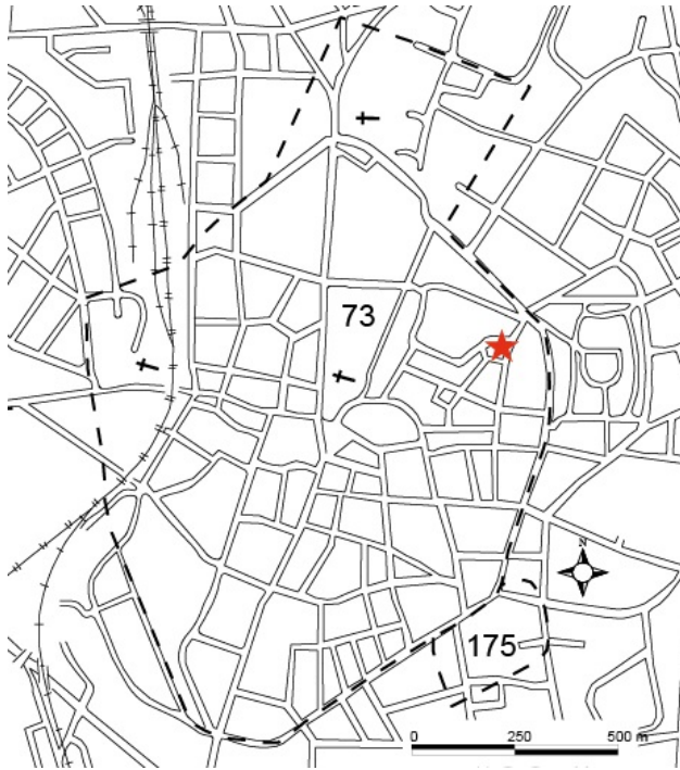
Figur 1. Lunds medeltida stad, fornlämning 73, med platsen för undersökningen markerad med en röd stjärna.