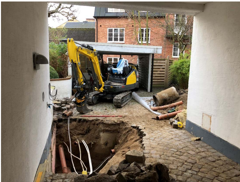
Figur 2. Översiktsfoto taget från norr. I bakgrunden syns ett rött tegelhus på vars tomt Sankt Thomas medeltida kyrkogård bör ligga enligt Andréns rekonstruktion, avståndet dit är ca 16 m (Andréns 1984 s 92).

Inga intakta medeltida kulturlager dokumenterades. Totalt schaktades en yta av 5 m 2 med en volym av 4 m 3 bort.