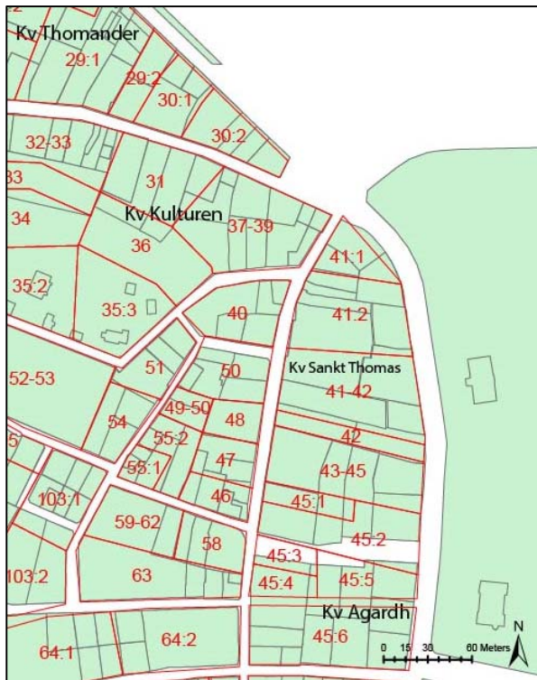
Figur 2. Röda linjer och röda siffror motsvarar tomter kring år 1500, enligt Andréns tomtrekonstruktion (1984). Grå linjer motsvarar dagens fastighetsindelning i respektive kvarter.