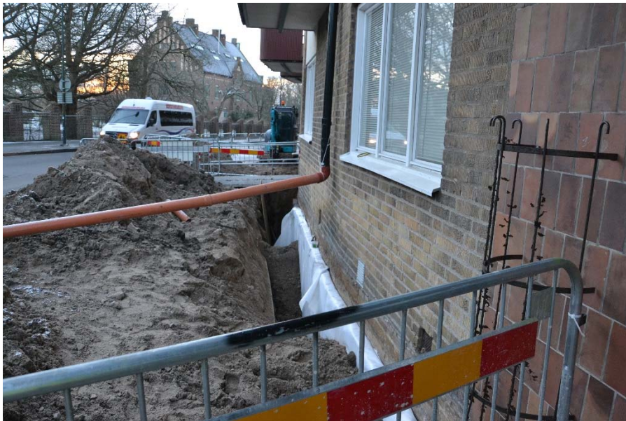
Figur 4. Översiktsbild över den södra delen av schaktet.