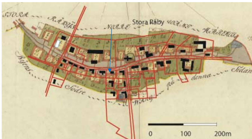
Figur 2. A M Langvagens karta över Stora Råby byplats 1801. Lantmäteriet i Malmö. Akt 3 Stora Råby. Dagens tomter och vägar markerad med röda linjer, byggnader markerad med svart. Gårdsläge nr 12 alternativt 16 som är aktuell i undersökningen markerad med en blå pil.

Under åren 1787-1789 ägde storskifte rum, och det hade till syfte att underlätta för bönderna att bruka jorden. Ett antal mindre jordlotter sammanslogs till större enheter, men konsekvensen blev ändå att lotterna spriddes ut på många ställen (Ohlsson 1954 s 19).