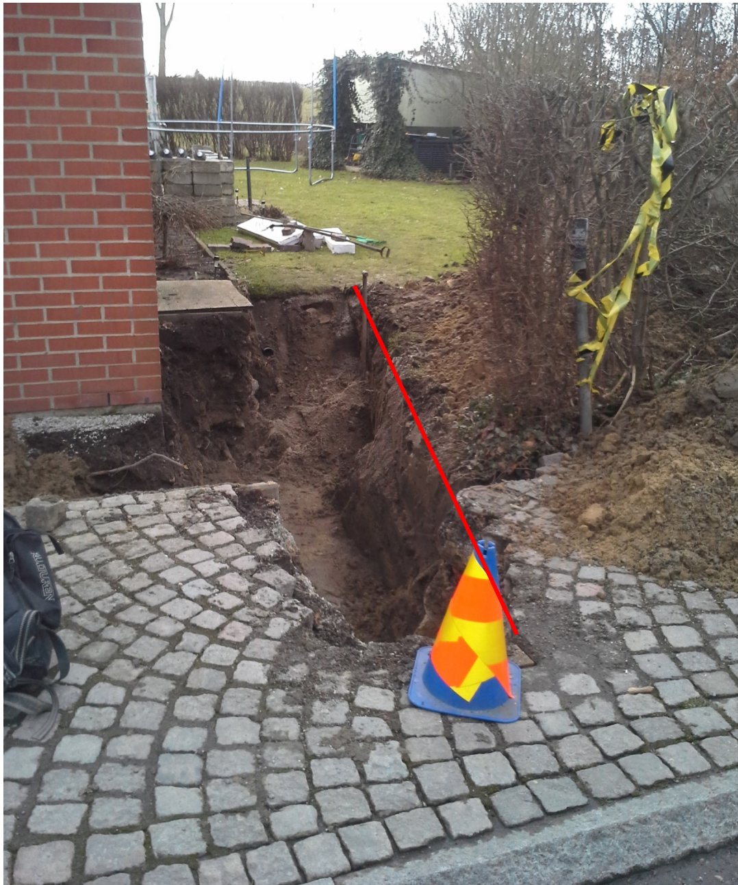
Figur 3. Området för schaktning vid fastighet Stora Råby 34:16 vid byggnadens västra gavel ut mot gatan. Den röda linjen visar var sektionsritningen är upprättad (figur 5). Fotografiet taget från norr.