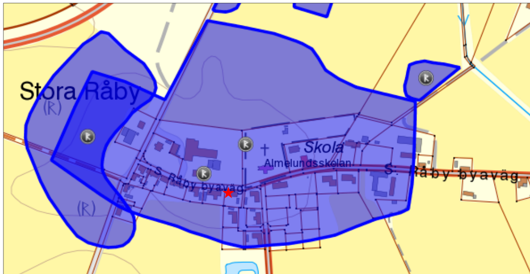
Figur 1. Stora Råby bytomt markerat med blått, fornlämning 10 markerat med blått och aktuell undersökningsplats markerad med en röd stjärna.