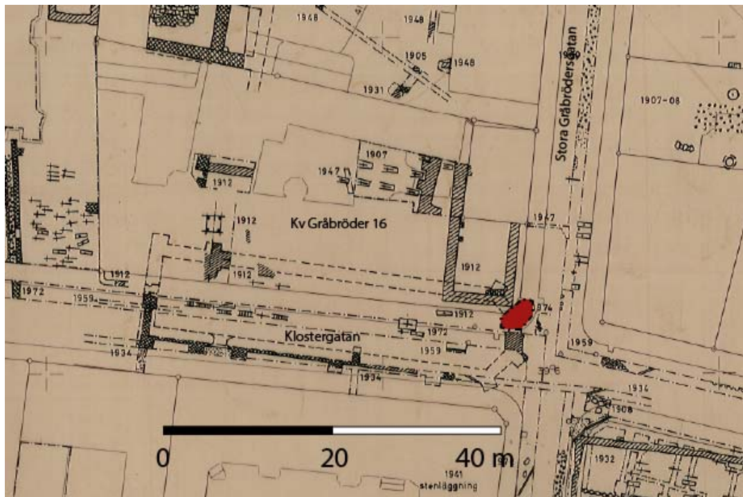
Figur 3. Kulturens arkeologiska generalkarta, aktuellt ingrepp är markerat med rött.

ingreppen. Dock framkom en tegelmurad brunn i schaktets sydvästra sida, som troligen anlades samtidigt som byggnaden på fastigheten Gråbröder 16, omkring 1880-talet.