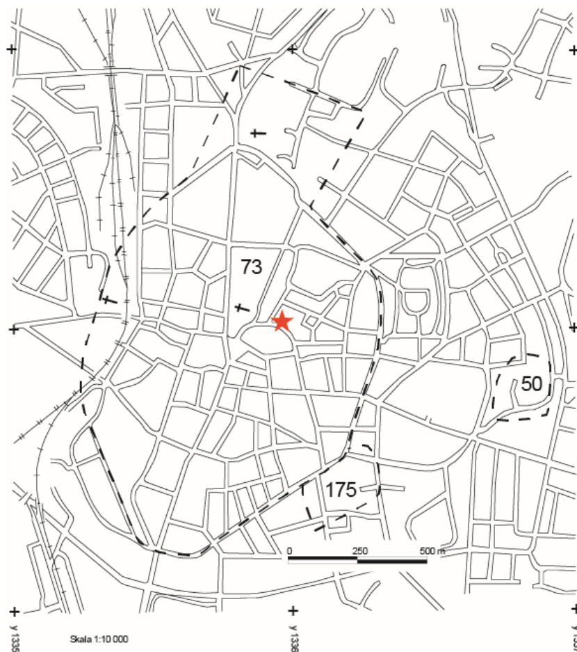
Figur 1. Lunds medeltida stadsområde, fornlämning Lund 73:1, med aktuell fastighet markerad med en röd stjärna.