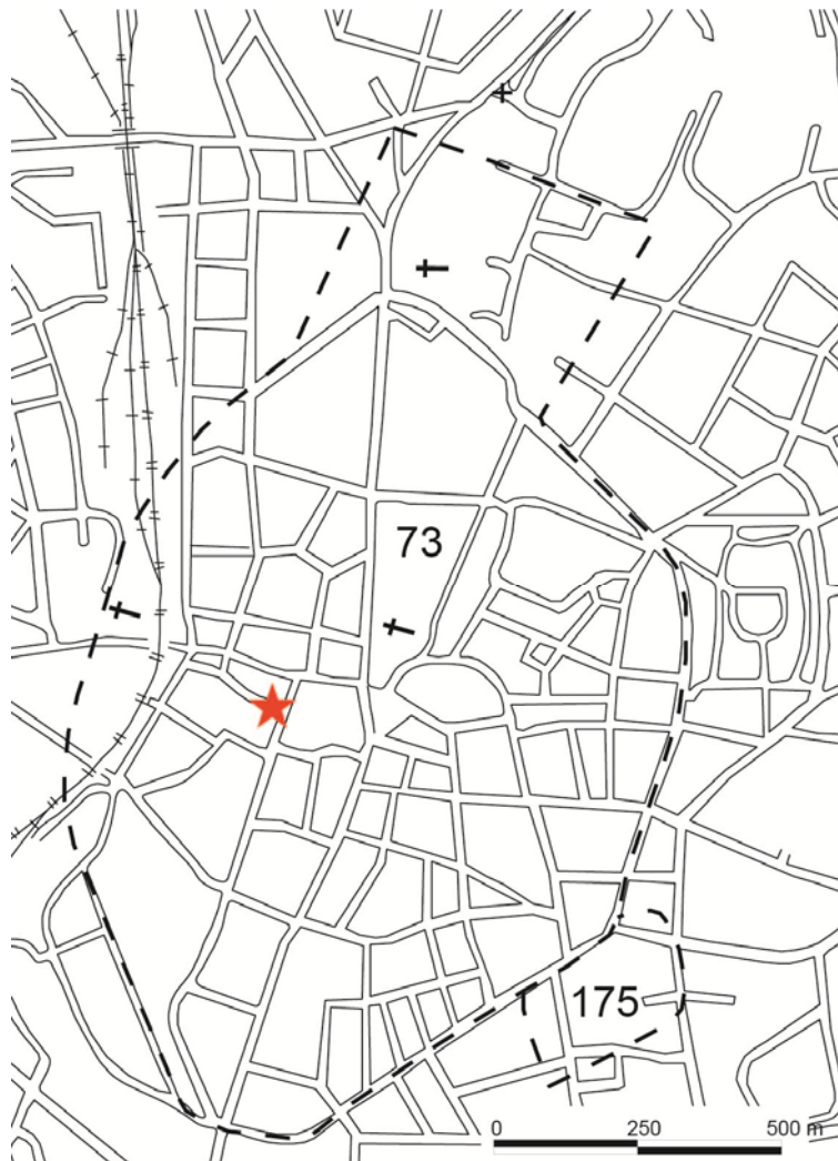
Figur 1. Lunds medeltida stad, fornlämning 73, med platsen för undersökningen markerad med en röd stjärna.