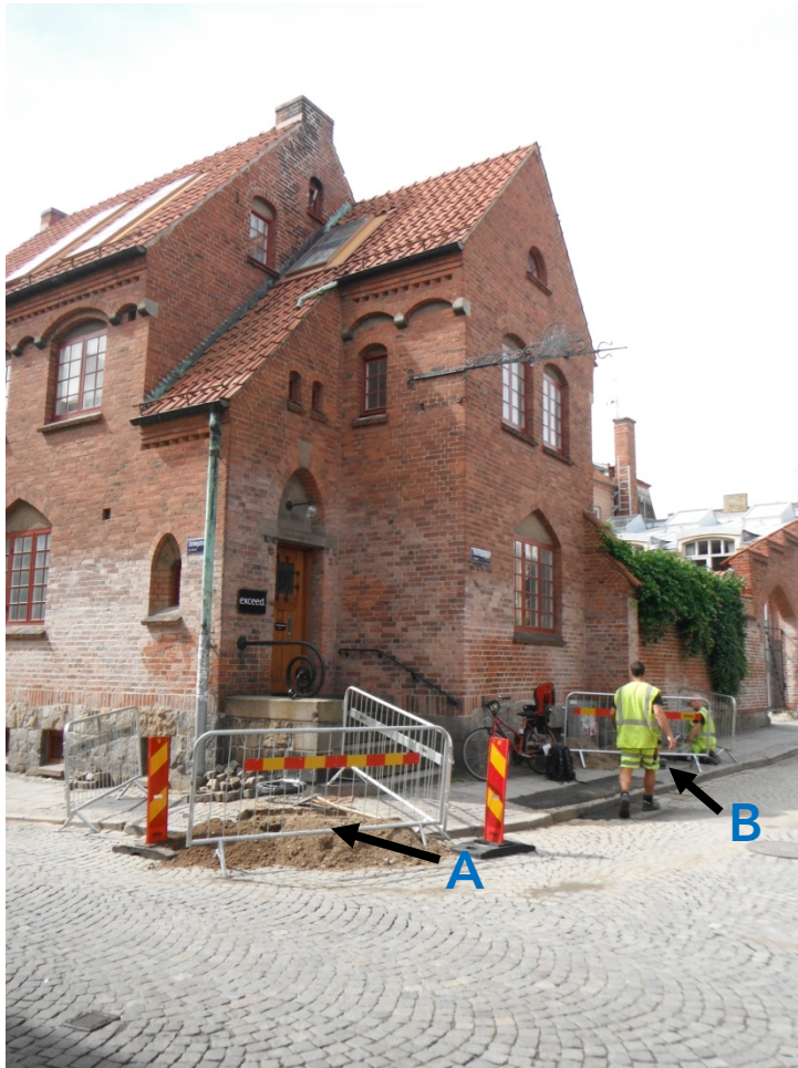
Figur 4. Schakt A och B i hörnet av Stora Fiskaregatan/Grönegatan.

Schakten gick som djupast ner till en nivå av 0,70 m under dagens marknivå och i två av schakten berördes endast sentida fyllning av grus (A och C). Dessa schakt berörde gatubeläggningsens bärlager av grus samt igenfyllningslagret av kabelschakten. I schakt B framkom lera från frischaktet tillhörande byggnad på kv Myntet 9 från 1915-16 . Leran innehöll träkol och tegelkross med viss grusinblandning och kan sannolikt härledas till grundläggningsarbetena då äldre kulturlager troligen grävts igenom, och senare blandats upp med grus.