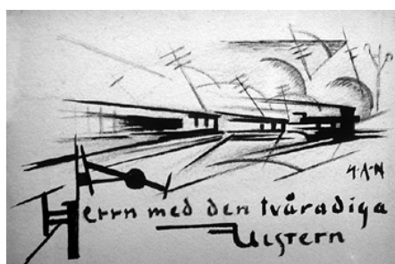
Gösta Adrian-Nilsson "Herrn med den tvåradiga ulstern" tuschteckning 1916.

Vi skall resa ca 200 år tillbaka i tiden till en bondgård i Blekinge – till tiden före industrialismen och tiden när "allt" gjordes av hantverkare. Sedan skall vi besöka två "platser" som ligger ungefär 90-80 år tillbaka i tiden. Det ena är Arbetarbostaden - ett vanligt hem i Lund där en arbetarfamilj bodde från 1924. Då har industrialismen brutit igenom och det finns helt andra saker än i Blekingegården. Det andra är en storstad i Europa vid samma tid, nämligen Berlin på 1910-20 talet, där allt det nya som industrialismen och modernismen skapade, syntes mycket tydligare än i lilla Lund.