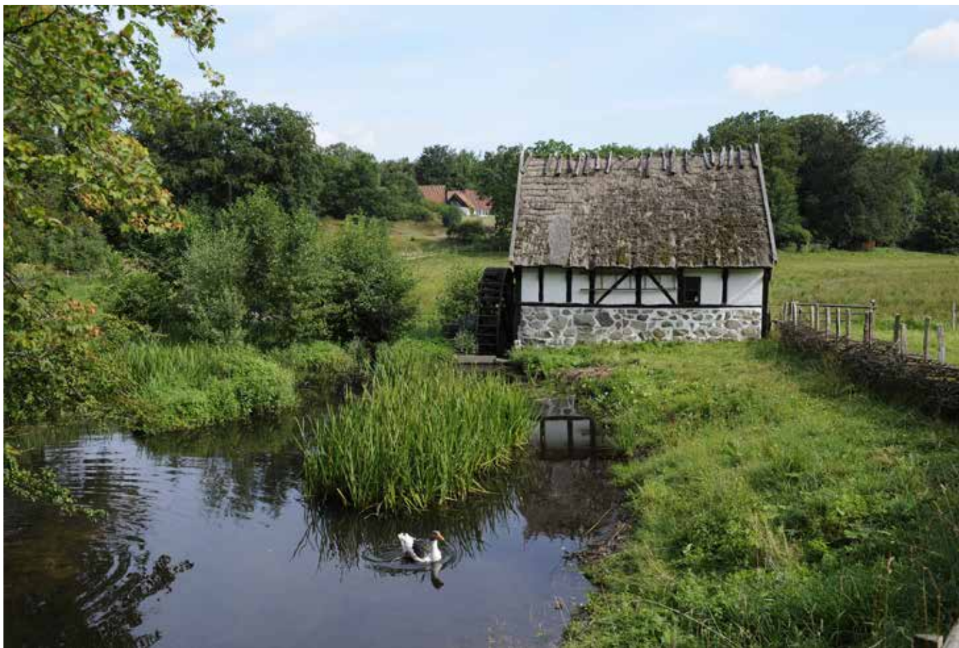
En augustidag på Kulturens Östarp.

hålls öppet av en ideell förening som säljer varor som passar in i miljön. Årets försäljning i museibutiken var bra och vi nådde över budgeterade en miljon kronor. Varusortimentet var kopplat till aktuella utställningar bl a Gudrun Sjödén. Under året har ombyggnaden av entré och butik planerats för att genomföras 2015. Caféet har utvidgats med två rum, men kostnaden är för hög för att hålla öppet året om. Caféet kommer enbart att hållas öppet maj–augusti under 2015.