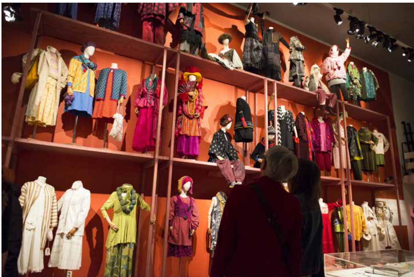
Besökare i utställningen Guðrun Sjöðén – 40 år av inspiration .