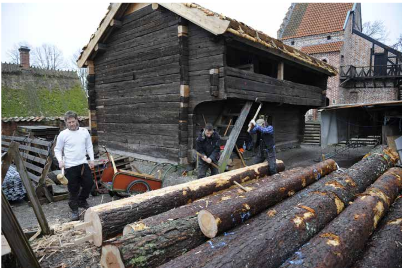
Klyvning av timmer till golvplank till Uranäsboden.