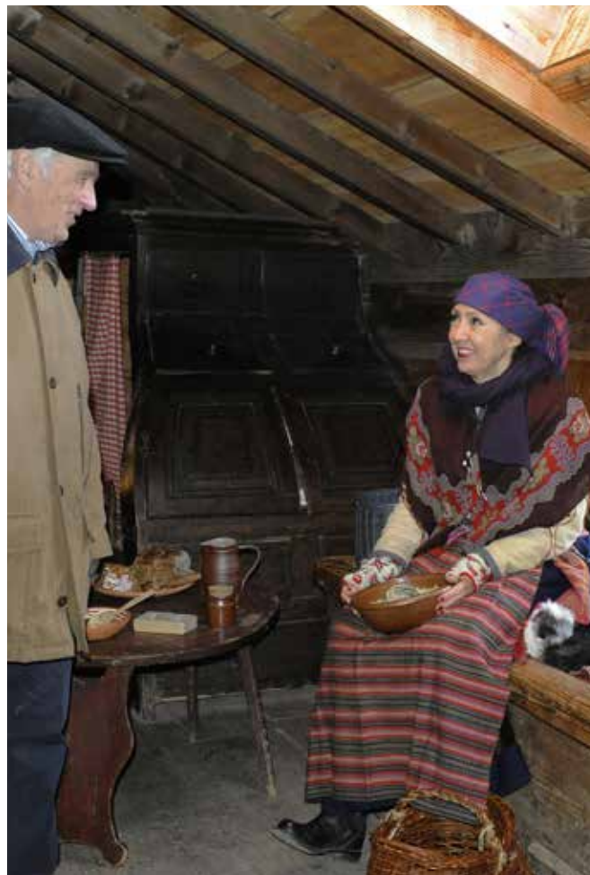
Museichefen möter besökare under Julstöket.