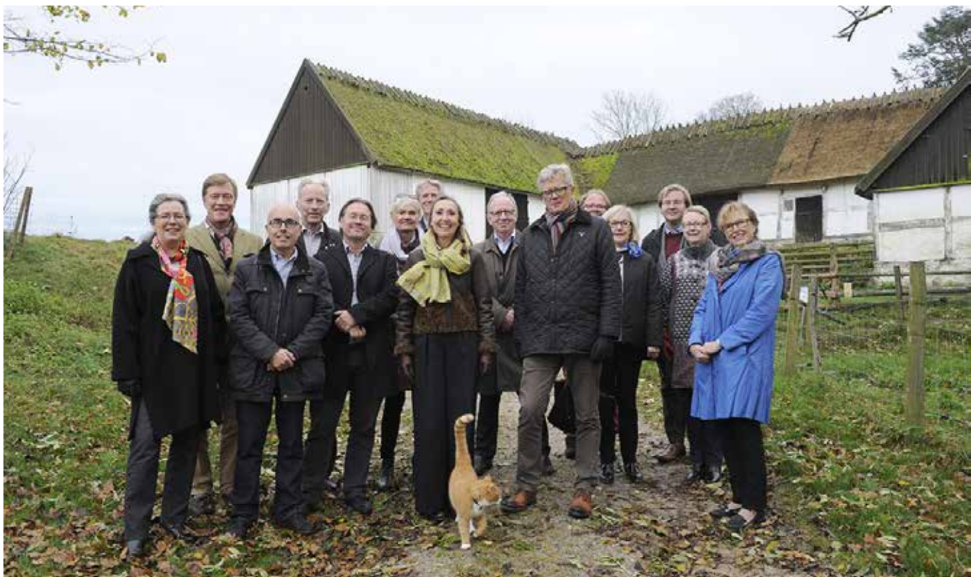
Kulturens styrelse på Kulturens Östarp hösten 2014.