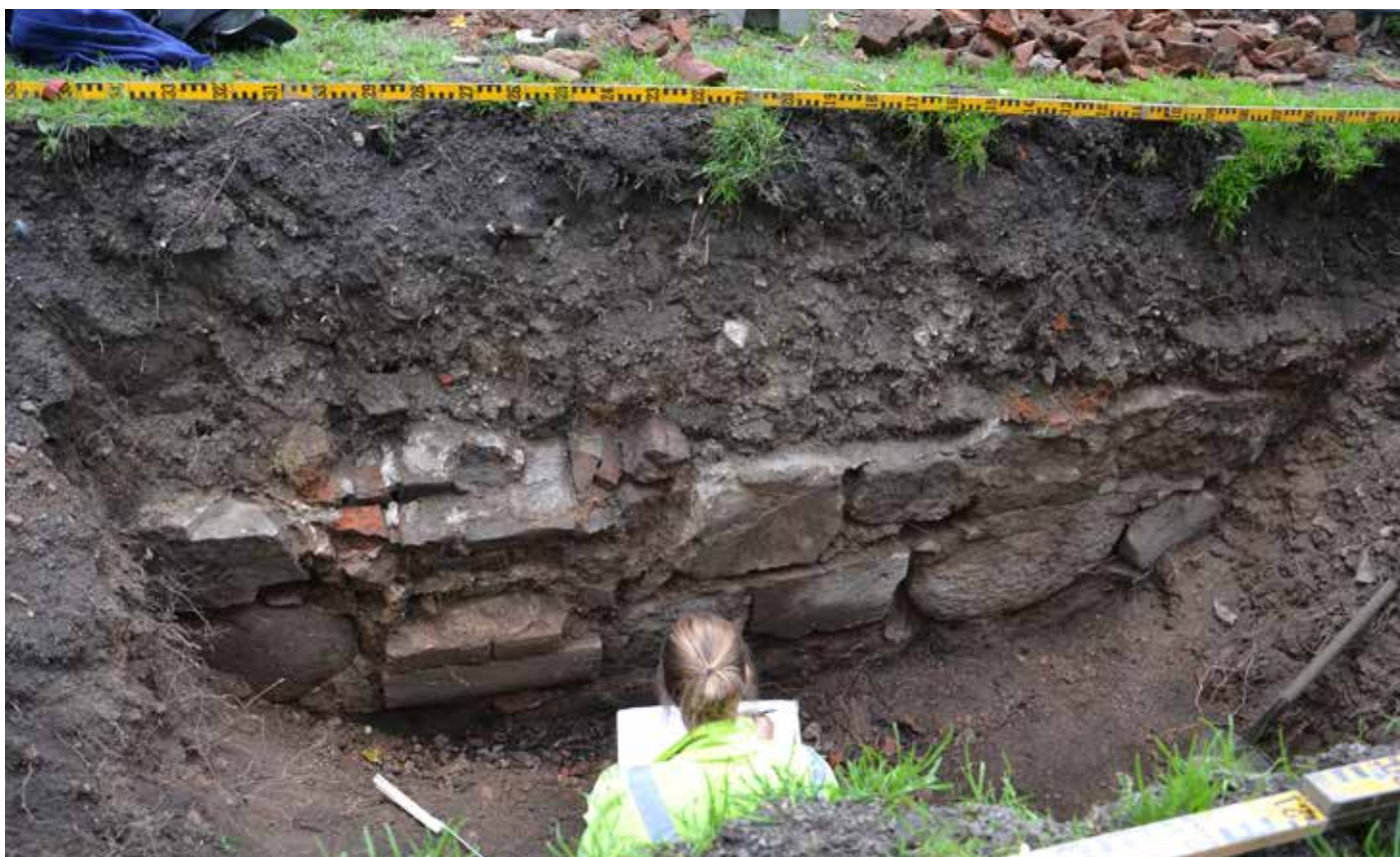
Arkeolog Aja Guldåker vid den medeltida mur som avtäcktes och dokumenterades under grävningar inför trädförnyelse i Lundagård.

besökare och elever fick möjlighet att diskutera demokratifrågor, jämställdhet och mångfald.