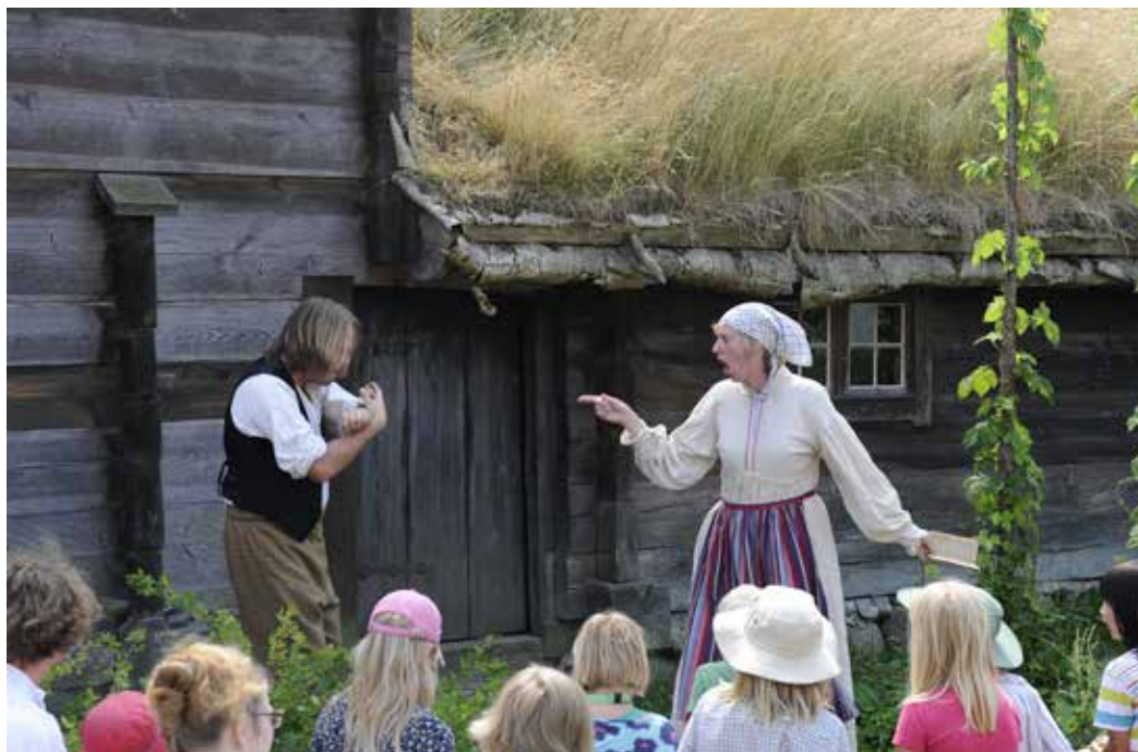
Levandegörande av friluftsmuseets hus genom Lekfulla tidsresor.

Kulturen har den ideella föreningen Kulturhistoriska föreningen för södra Sverige som huvudman. Det är en medlemsförening som förvaltar Sveriges största samling av kulturhistoriska föremål från södra Sverige, stora samlingar av jämförande föremål från hela världen samt norra Europas största medeltidsarkeologiska samling.