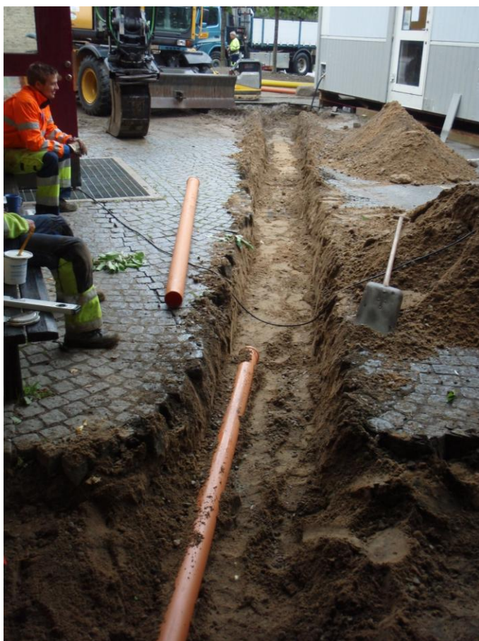
Figur 3. Schaktningen företogs huvudsakligen i befintliga bärlager.

I kabel- och rörschaktet norr om dokumenterad sektion, berördes inga intakta medeltida kulturlager. Schaktets längd var ca 15 m och bredd 0,5 m. Schaktdjupet var 0,4 m med fall och innehöll endast yngre fyllning av grus och makadam.