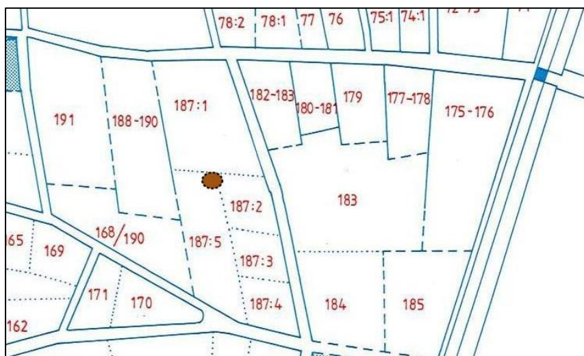
Figur 2. Området för schaktning (orange markering) i jämförelse med Andréns rekonstruktion av tomtindelning under 1500-talets medeltida Lund.